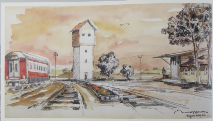
Uzunköprü tren istasyonu