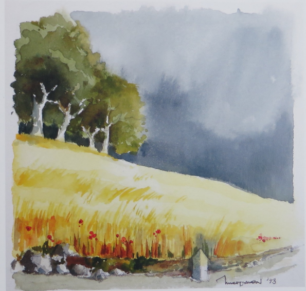
Yaz yağmurunda buğday tarlaları