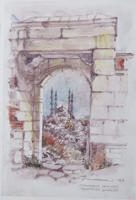
Muradiye Camii'nden Selimiye