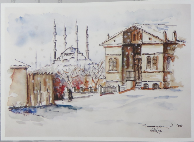
Karlı bir günde Selimiye