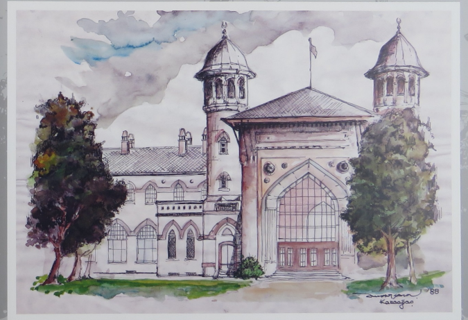
Karaağaç Eski Gar Binası