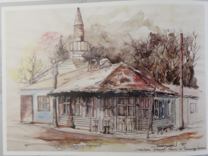
Sarayhanı Çakırağa Camii ve Tahsinpaşa Kahvesi