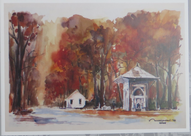
Sonbaharda Karaağaç yolu