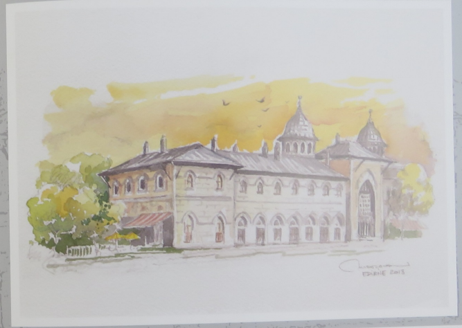
Trakya Üniversitesi Rektörlük binası - Eski Edirne Garı