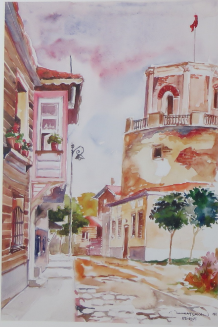
Bir eski Edirne sokağı