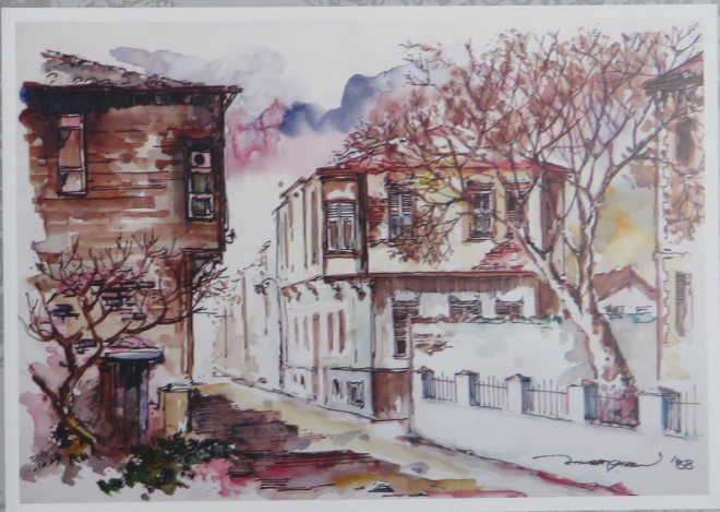
Sonbaharda Eski İstanbul Caddesi