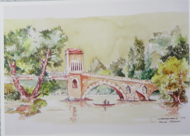
Tunca Nehri ve Köprüsü