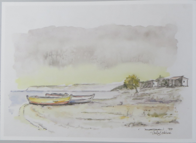
Yağmur sonrası Vakıf sahili