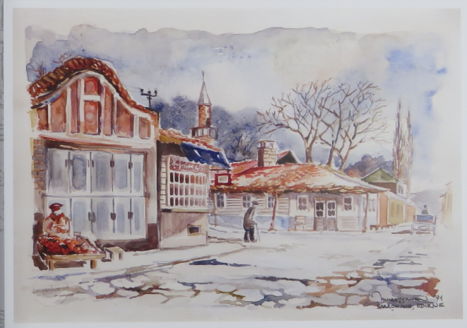
Saraçhane Çakırağa Camii ve Tahsinağa Kahvesi