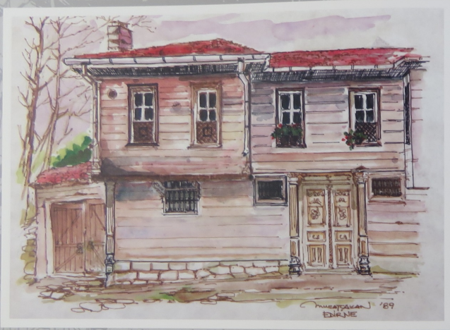
Edirne'de eski bir ev