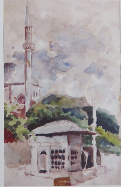
Ayşekadın Camii ve sebil