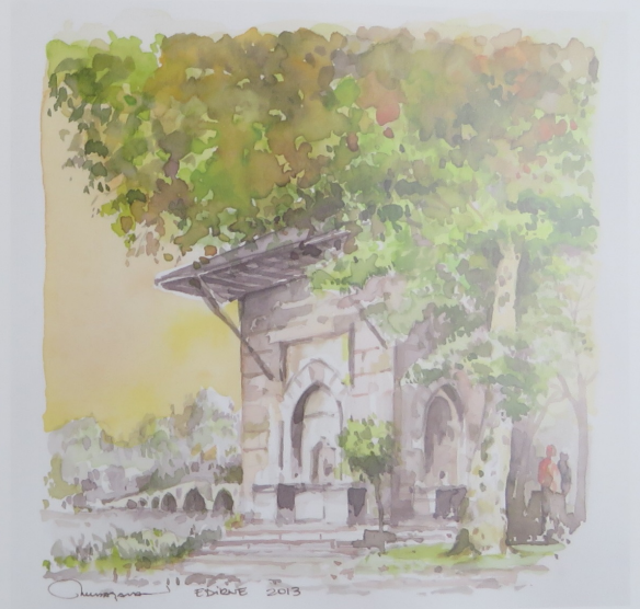
Hacı Adli Bey Çeşmesi