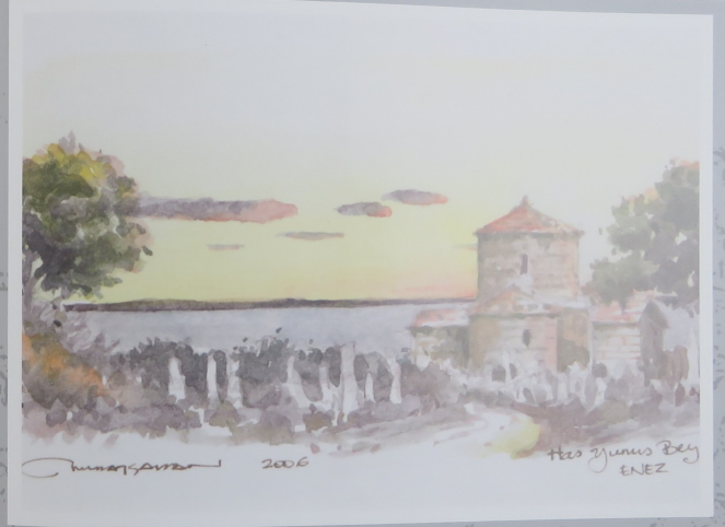
Has Yunus Bey Türbesi, Enez