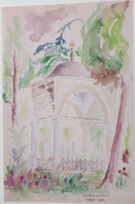
Selimiye Camii'nin bahçesinde bir türbe