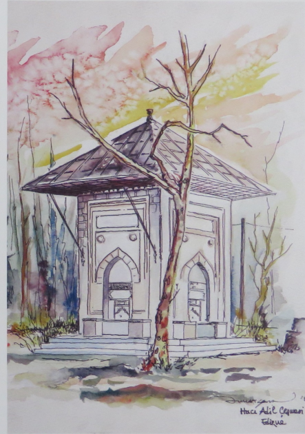
Hacı Adil Bey Çeşmesi