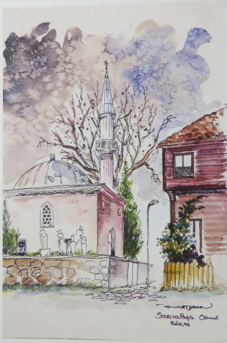
Sarıca Paşa Camii