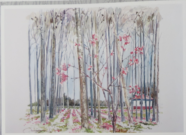
Bosnaköy yolunda bahar