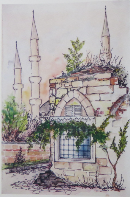
Mezit Bey Sebili