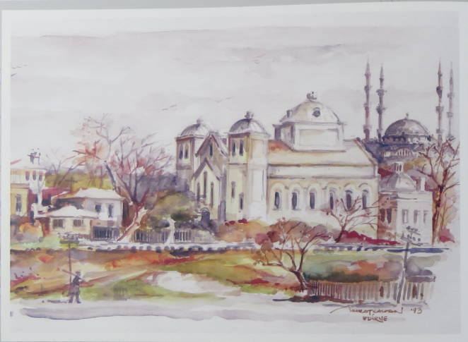
Dinleri bütünleştiren Selimiye ve Havra