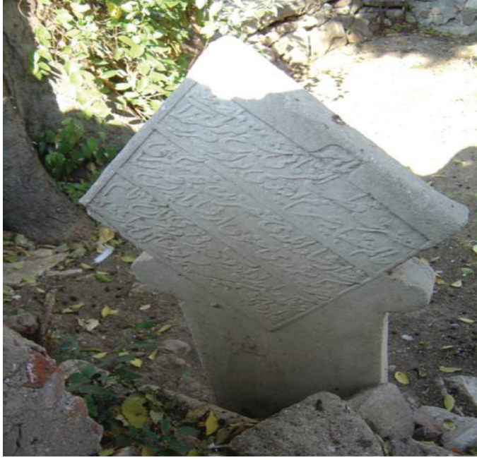
Ek-1. Kabûlî'nin mezar taşı kitâbesi.