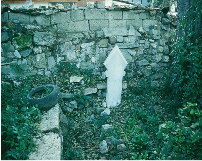
Ek-2. Kabûlî'nin mezarının cephe görünümü (N. Çiçek Akçıl Arşivi).