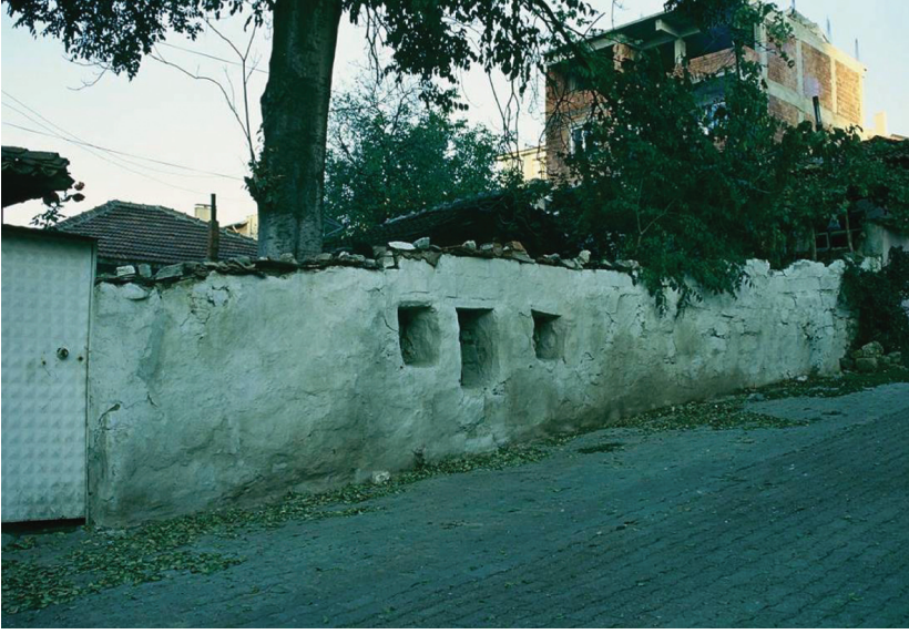
Ek-3. Kabûlî nin mezarının dıştan görünümü (N. Çiçek Akçıl Arşivi).