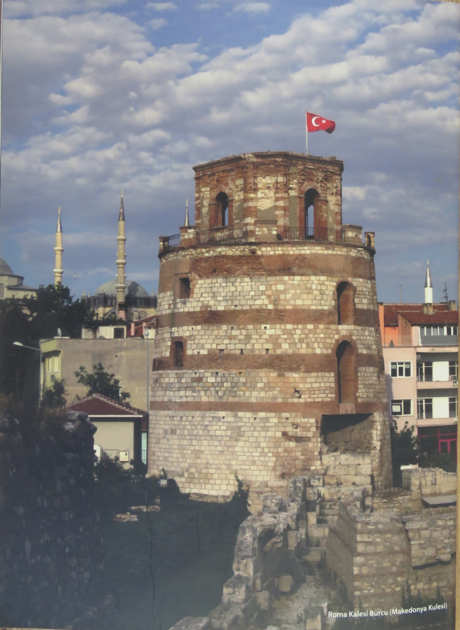
Roma Kalesi Burcu (Makedonya Kulesi)