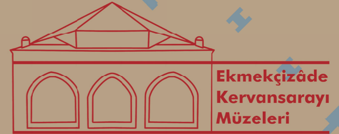
Ekmekçizâde Kervansarayı Müzeleri

IN THIS SECTION OF THE MUSEUM, OTTOMAN ARCHITECTURAL WORKS IN THE BALKANS ARE PRESENTED WITH MAKEUPS, MOVIES AND STORIES.