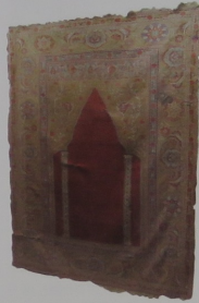
17. yüzyıl seccade (Eski Camii)

olarak müze'nin en eski eserleri arasında bulunuyor. Bu eserler, bölgeye özgü kültürün belgeleri olarak sergileniyor.