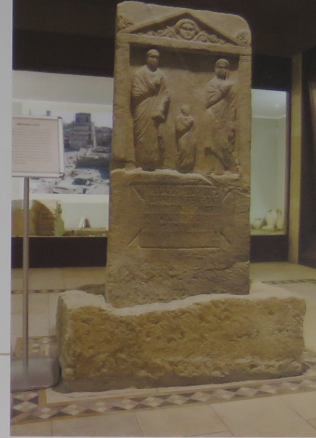
Roma Dönemi mermer mezar steli

Müze'nin bahçesinde, salonlara sığmayan büyük taş eserler sergileniyor. Roma lahidi, dolmen ve menhirler, Osmanlı mezar taşlarıyla, Helenistik, Roma ve Bizans dönemi sünen başlıkları da bu eserler arasında.