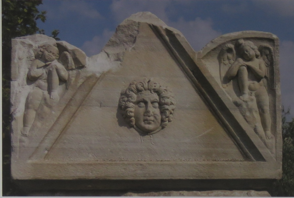
Roma Dönemi mermer lahit kapağı

müze binası, 13 Haziran 1971'de Arkeoloji ve Etnografya Müzesi adına hizmete açıldı. Dar'ül Tedris Medresesi'ndeki müzeve de Türk İslam Eserleri Müzesi adı verildi. Halen müze'nin birimi olarak hizmet veren bu müze de önümüzdeki yıl restorasyona girecek.