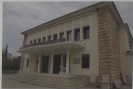
Edirne Arkeoloji ve Etnografya Müzesi

Siz de iki saatünüzü ayırarak, Edirne Arkeoloji ve Etnografya Müzesi'nin gezebilir, binlerce yıllık uyarlılık birikiminin günümüze taşıdığı kültür mirasını yakından tanıyabilirsiniz. Unutmayın, müze pazartesi günleri hariç hergün 9.00-17.00 saatleri arasında açık!