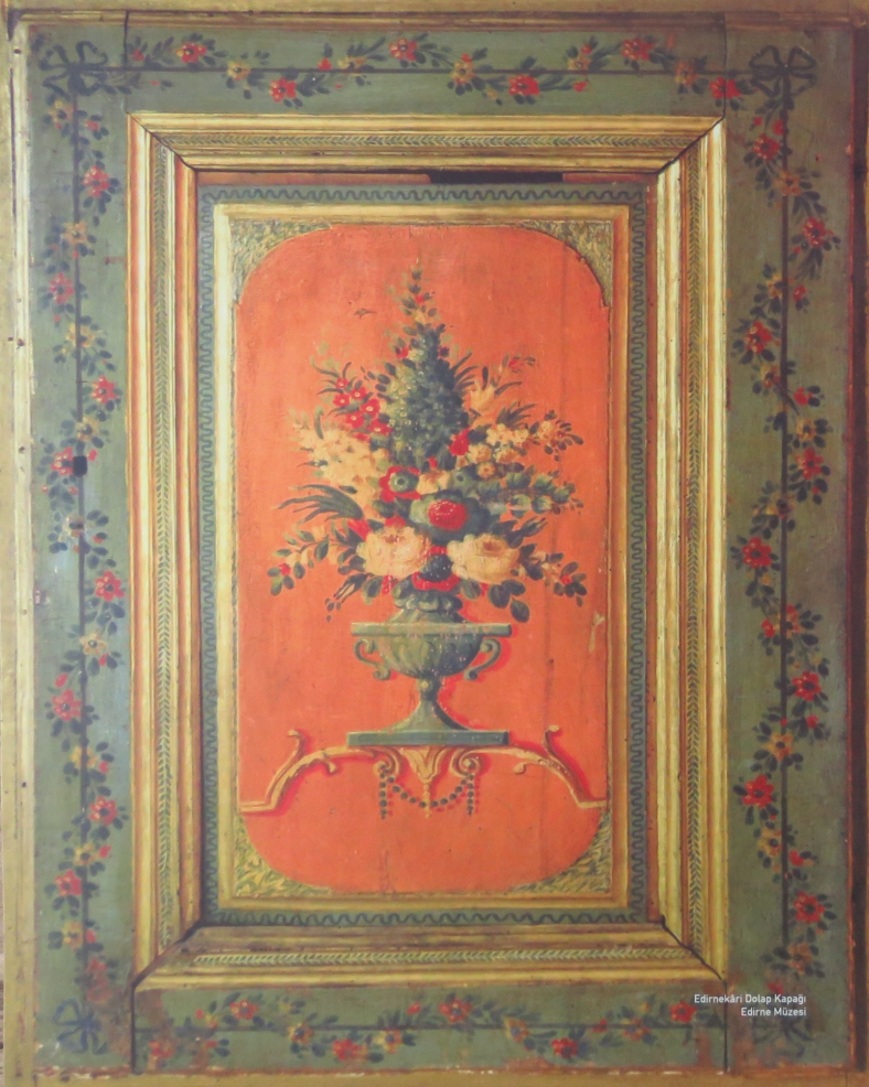
Edirnekâri Dolap Kapağı Edirne Müzesi