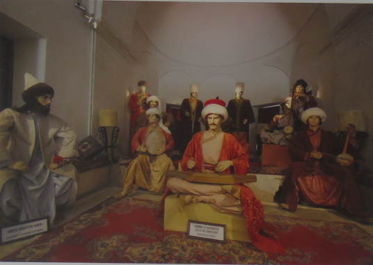
Ratip Kazancıgil'in kuruluşuna öncülük ettiği Sultan II. Bayezid Külliyesi Sağlık Müzesi (Edirne Darüşşifası)

Hocamızla birlikte düşündüğümüz Sağlık Müzesi fikri uzun yıllar buz-dolabına konuldu.