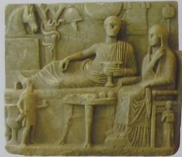
Roma Dönemi mermer mezar steli

Edirne Arkeoloji ve Etnografya Müzesi'nin vitrinlerinde sergilenen eserler tarih boyunca hüküm süren uygarlıklara ışık tutuyor. Sahip olduğu zengin koleksiyonlar artık galerilerine sığmayan Edirne Müzesi, kapsamlı bir onarım çalışmasının ardından kapılarını ziyaretçilerine açtı.